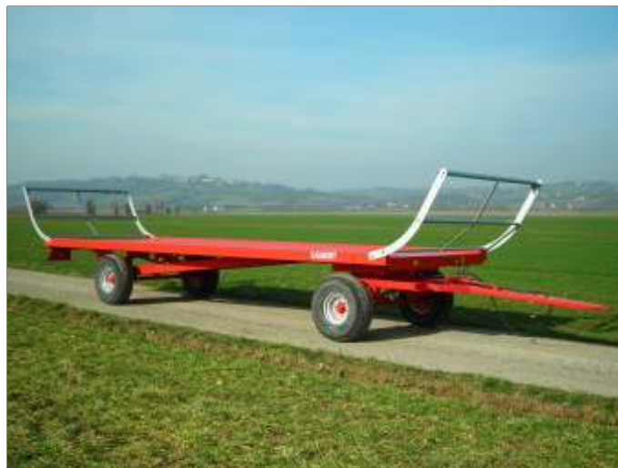
1 modèle en version Traînée