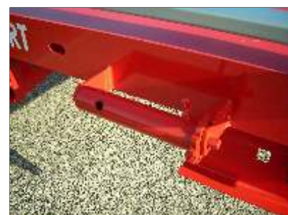
2 tours de billage situés à l'arrière du plateau