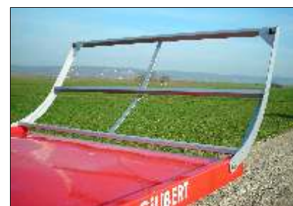
Berceaux galvanisés avec fixations latérales