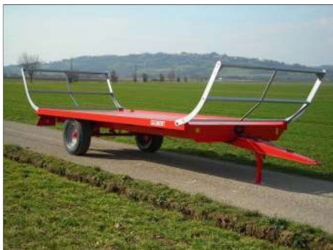
2 modèles en version Semi Portée

3 modèles de plateaux fourragers parfaitement conçus pour répondre à vos besoins: