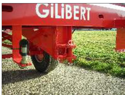
Crochet d'attelage arrière et prise gyrophare