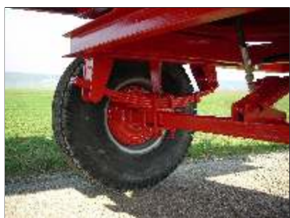
Avant-train avec suspension ressort à lames