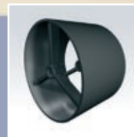
Planring 505 mm