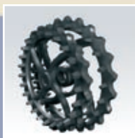
Crosskill ringe 485/530 mm