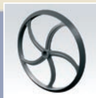
Bølgering 500 mm