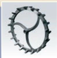
Knastring 550 mm