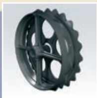
Cambridge ringe 450 mm, 510 mm. 620 mm kun til Lift-Roller