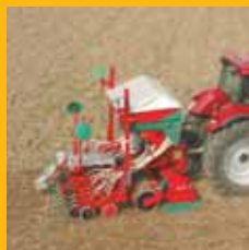
Kverneland Herse Rotatives.

La gamme d'outils à dents Kverneland est constituée de machines pour tous types de besoins : Décompactage, Déchaumage, préparation du lit de semences, notre large offre permet de répondre à la plupart des demandes.