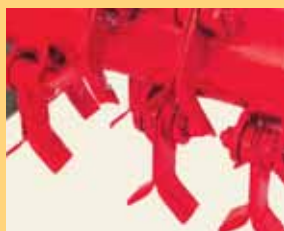
Couteaux en Y