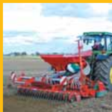
Kverneland Herse Rotatives.

La gamme d'outils à dents Kverneland est constituée de machines pour tous types de besoins : Décompactage, Déchaumage, préparation du lit de semences, notre large offre permet de répondre à la plupart des demandes.