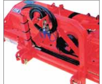
Attelage déportable hydraulique, course 38 cm.

1) Nombre de marteaux, lorsque le broyeur en est équipé. Tous les modèles disposent d'un attelage catégorie I et II.