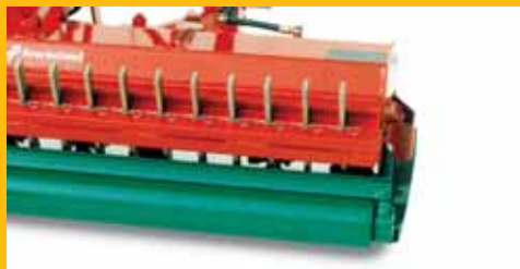
Le broyeur Kverneland FH peut recevoir un rateau à dents pour améliorer le broyage des sarments.