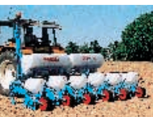
Semoirs pneumatiques polyvalents à socs NC.