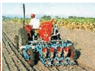
Semoirs maraîcher spécial minigraines MS.