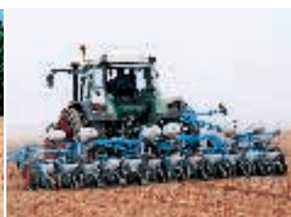
Semoirs mécaniques à betterave enrobée MECA 3.