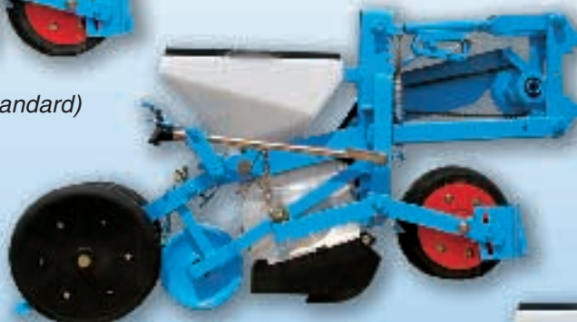
MECA V4 Balancier