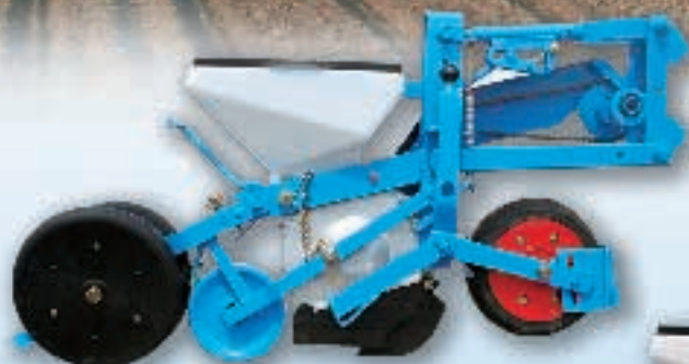
MECA V4 Jauge avant (Standard)