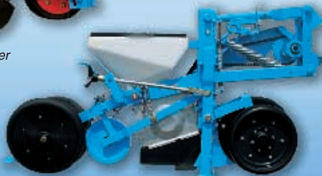
MECA V4 Double-disques