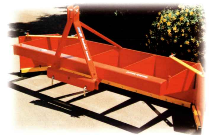
LOURD 310 kg