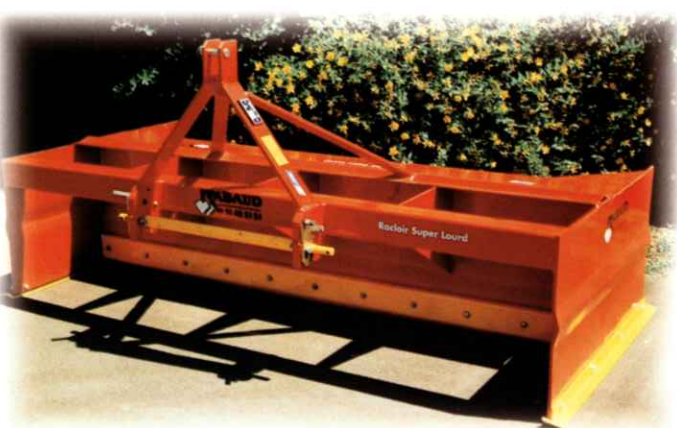
SUPER-LOURD 500 kg

Pour nettoyer vos stabulations, racler vos cours, terrasser un talus, niveler un chemin combler vos tranchées de drainage, étendre l'ensilage.