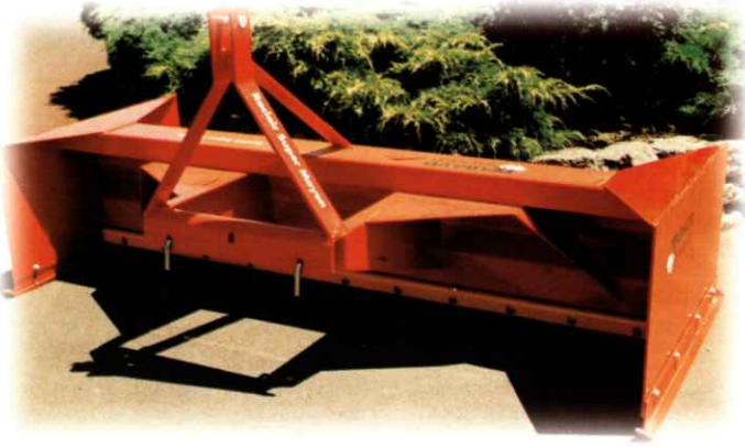
SUPER-MOYEN 230 kg