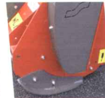
• Patins d'usure réglables