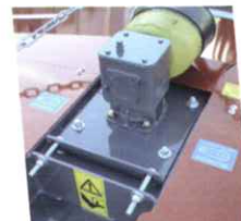
• Réglage tension des courroies