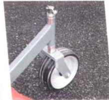
• Roue pivotante réglable