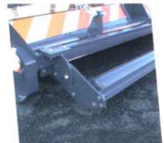
• Rouleau en option