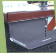
• Patin réglable