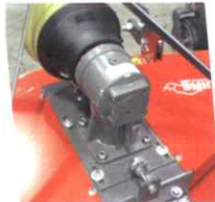
• Réglage tension des courroies