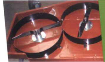
• Kit mulching