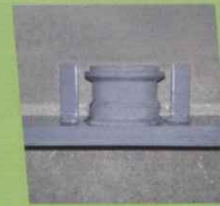
• Coupe lianes