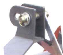
• Attelage Flottant