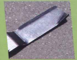
• Lames contre coudées ventilantes