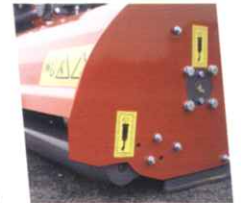
• Réglage de la hauteur de coupe par rouleau